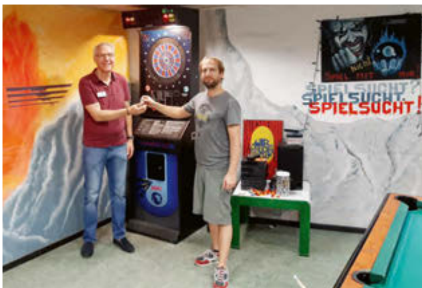
Game on: Am neuen Dart-Automat im Freizeitbereich kann jetzt gespielt werden.